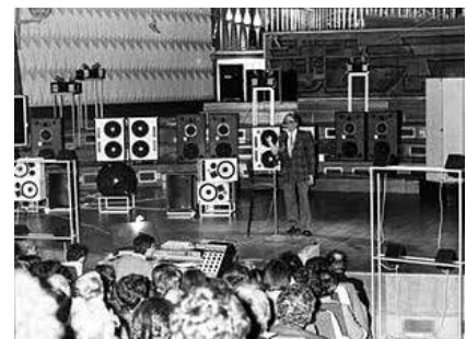
Pierre Schaeffer présentant l'Acousmonium

qui correspondent à des époques, des écoles ou des lignées, et des lieux différents.